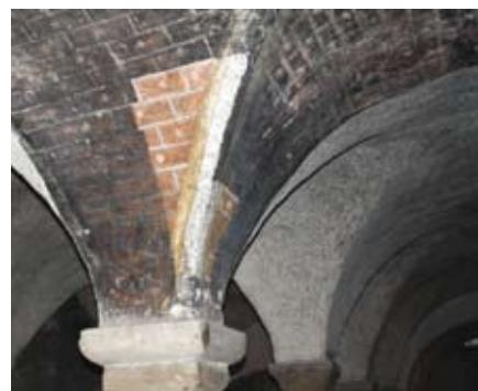
Échantillon de nettoyage d'une voûte de la crypte.

Les voûtes étaient recouvertes de peintures murales, dont un beau Christ en gloire que Francis Sallé Juillet 2014 du XIII e siècle. Elles ont malheureusement été en partie brossées par des personnes soucieuses d'en nettoyer le noir de fumée des cierges, et on ne pourra pas tout reconstituer. Mais les quelques échantillons de nettoyage qui ont été réalisés sont très prometteurs.