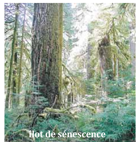
Îlot de sénescence