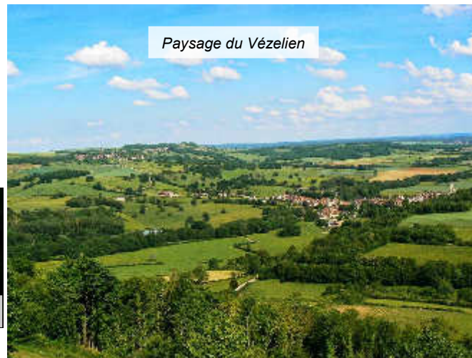
Paysage du Vézélien