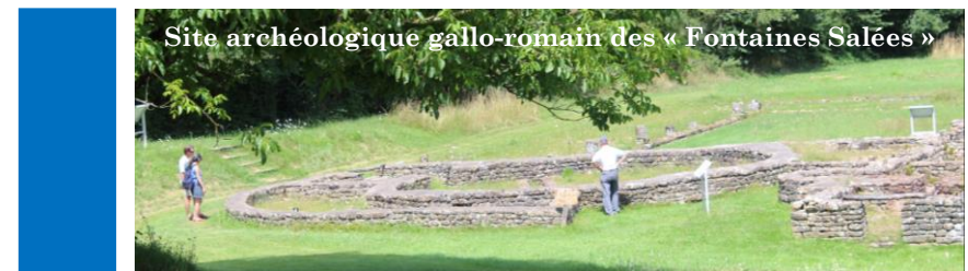
Site archéologique gallo-romain des « Fontaines Salées »