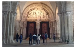
Tympan du narthex