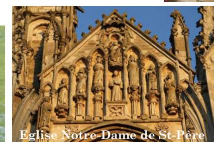
Eglise Notre-Dame de St-Père