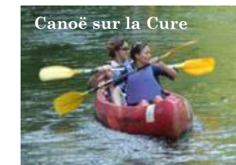
Canoë sur la Cure