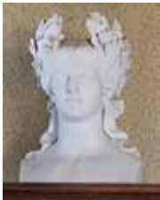
Le buste de Marianne