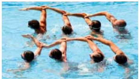
Natation synchronisée masculine